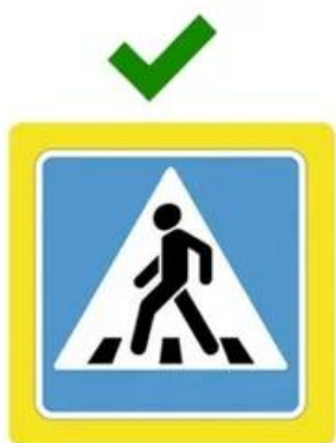
Наземный пешеходный переход