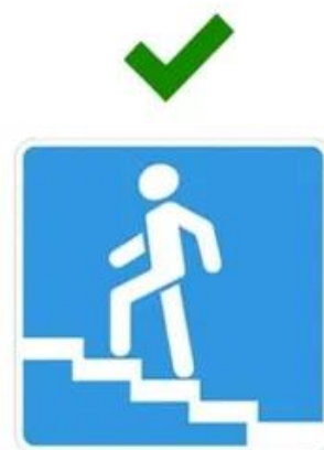
Надземный пешеходный переход