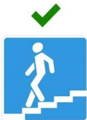
Подземный пешеходный переход